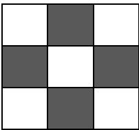
Carré de côté 3 carreaux